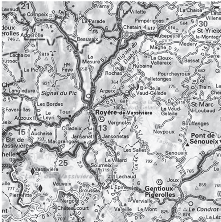
Figure 2. Carte départementale Michelin Creuse, Haute-Vienne

Dans La Carte et le territoire , Jed Martin tient une exposition sur ses photos des cartes Michelin dont le titre est « LA CARTE EST PLUS INTÉRESSANTE QUE LE TERRITOIRE » (Houellebecq, 2010, p. 80). Le héros se sent sublimé et bouleversé devant les cartes routières Michelin 5 . Le sentiment de « palpitation » provient de la technologie cartographique – l'approche clinique s'unit encore une fois aux émotions pathétiques.